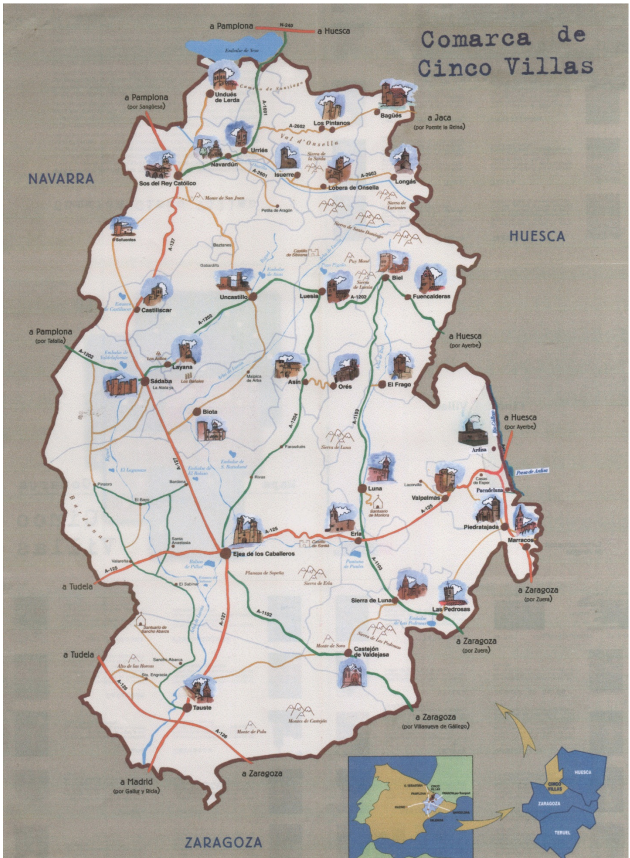
Mapa de la comarca de Cinco Villas